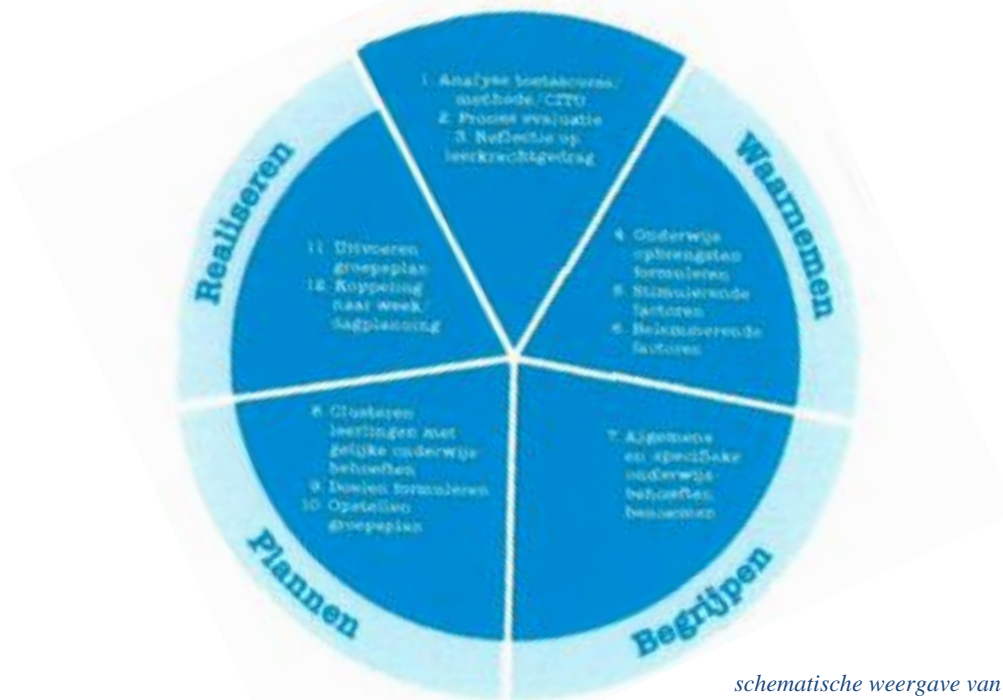
schematische weergave van de HGW cyclus

De hierboven omschreven cyclus wordt tweemaal per jaar doorlopen. De eerste periode loopt tot aan de kerstvakantie en de tweede periode loopt tot aan de zomervakantie.